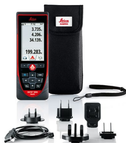
Leica DISTO™ D810 touch Art. No. 792297

Leica DISTO™ D810 touch, ポーチ, ハンドループ, USBチャージャー, Calibration Certificate Silver, クイックスタートガイド