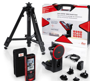
Leica DISTO™ D810 touch Case Art. No. 806648

Leica DISTO™ D810 touch, ポーチ, ハンドループ, USBチャージャー, Calibration Certificate Silver, クイックスタートガイド