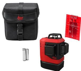
Leica Lino L6Rs Art. No. 918976

Leica Lino L6R, アルカリ乾電池用バッテリートレイ, 3 x 単3形アルカリ乾電池, ターゲットプレート, クイックスタートガイド, Calibration Certificate Blue, ポーチ