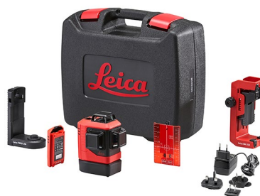
Leica Lino L6R Art. No. 912969

Leica Lino L6R, アルカリ乾電池用バッテリートレイ, 3 x 単3形アルカリ乾電池, ターゲットプレート, クイックスタートガイド, Calibration Certificate Blue, ポーチ